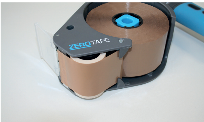
3. Klebeband bis zur Sicherheitsklinge ziehen