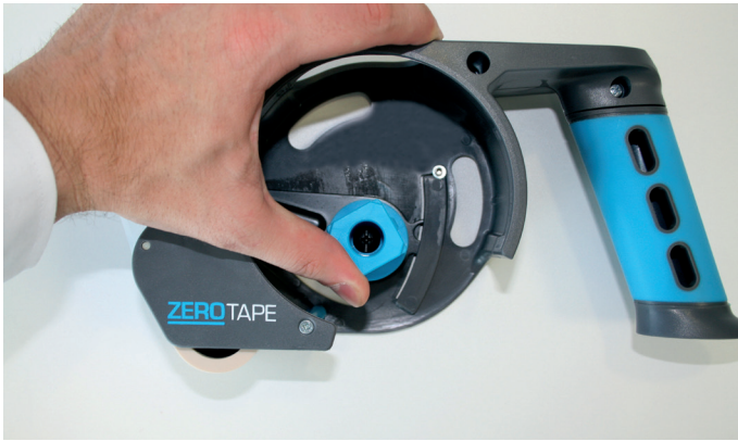
1. Kernaufnahme bis zum Einrasten nach oben drücken

Einlegen des Klebebands in den ZEROTAPE® Abroller: