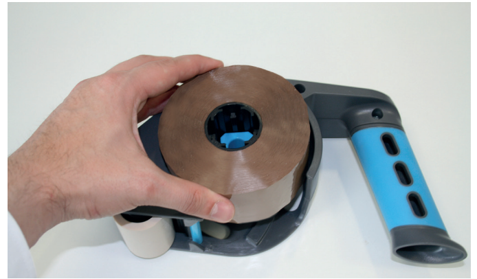
2. Klebeband einlegen