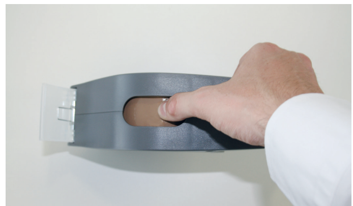
4. Klebeband durch die obere Öffnung nach unten drücken