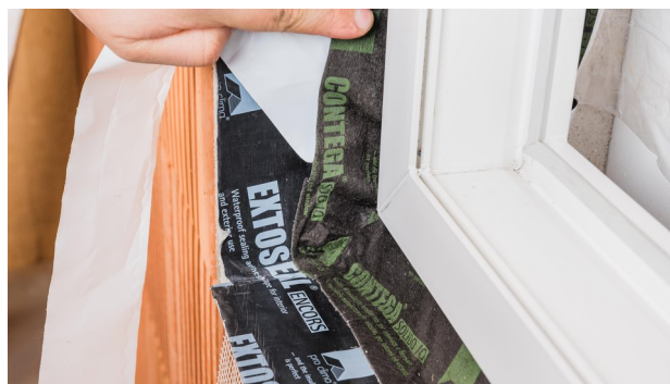
8. Ecken verkleben An den Ecken des Fensters Eckfalten luftdicht (Innenseite) bzw. schlagregensicher und wasserführend (Außenseite) mit der Leibung verkleben.