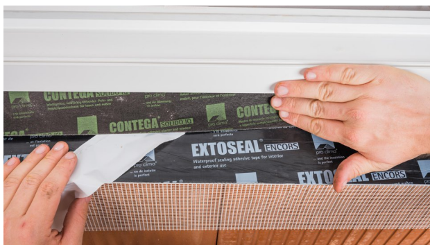
7. In der Leibung verkleben und anreiben Trennfolienstreifen abziehen und Band umlaufend verkleben.