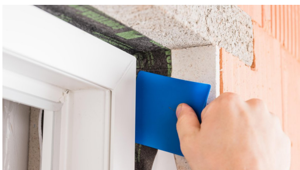
9. Fest anreiben Band umlaufend mit der Anpresshilfe pro clima PRESSFIX fest anreiben.