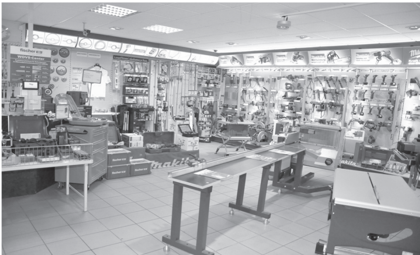
Die beeindruckende Maschinenpräsentation in unserem Laden !