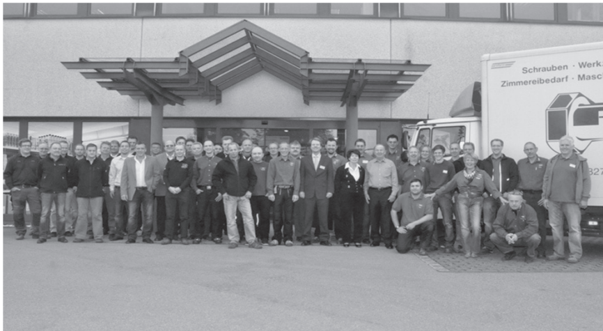
Das Hansen-Team und einige Aussteller anlässlich der Hausmesse 2012