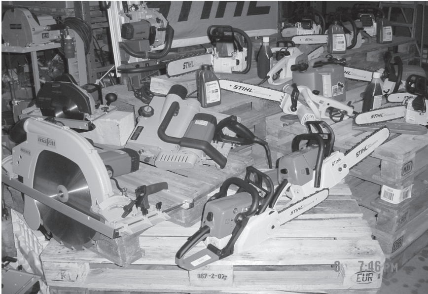
Mafell / Stihl-Präsentation auf der Hausmesse

Halben-Schienen Art. 604 siehe Seite 12/72 !