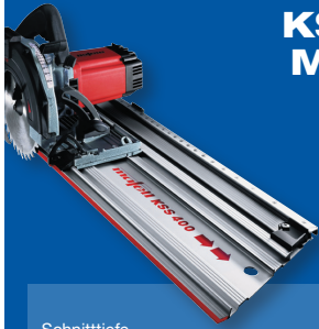
Kapp-Sägesystem KSS 300 MidiMAX im MAFELL-MAX EDV-Nr. 606004