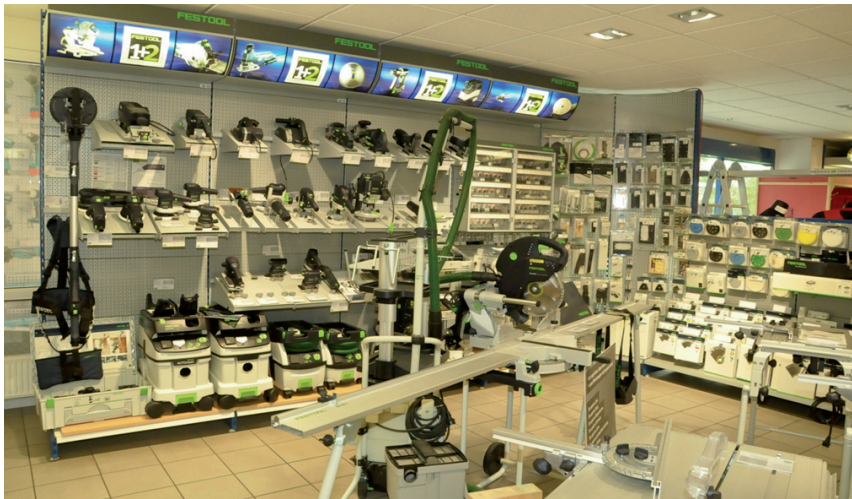
Festool-Maschinen-Präsentation in unserem Verkaufsraum !