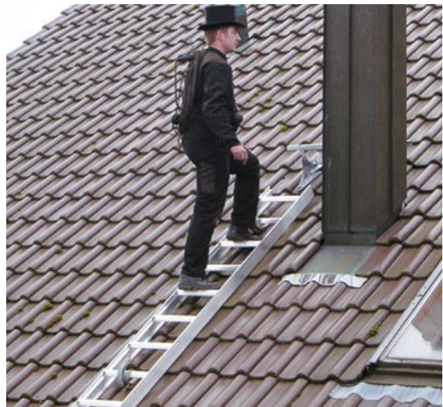
Abb. Bestell-Nr. 11113