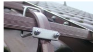
Abb. Bestell-Nr. 11204

- Untere Reihe < 1,50 m oberhalb der Traufe, jeweils gemessen in der Dachneigung - Der horizontale Abstand der Sicherheitshaken einer Reihe darf nicht mehr als 2,00 m betragen Anzuwenden bei Traufhöhen über 3,00 m!