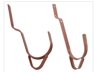
Abb. Bestell-Nr. 11119 und Bestell-Nr. 11219