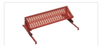
Abb. Bestell-Nr. 11176