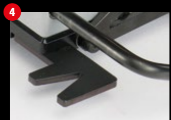
Visiere auf beiden Seiten erleichtert die Führung nach Linie