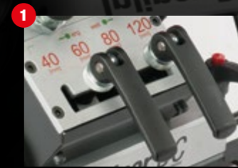
Regler für Abstände