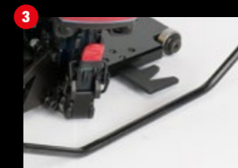
Anschlagbügel zur Führung entlang der Plattenkante