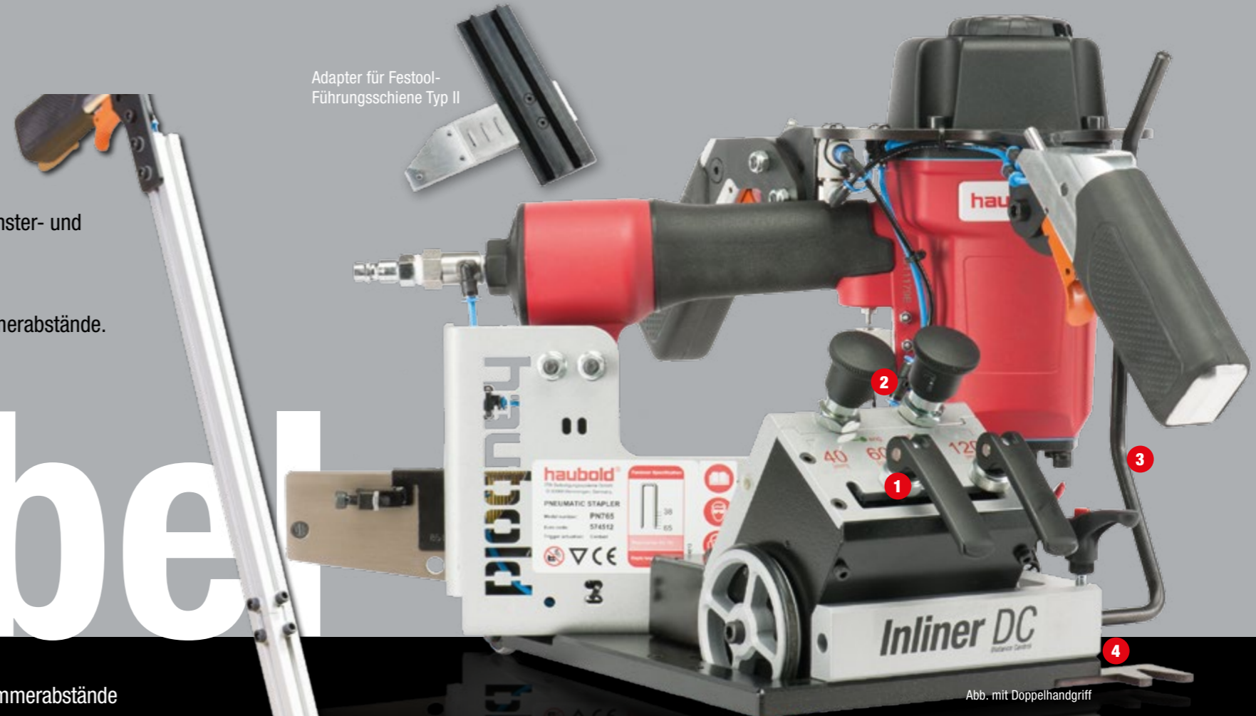
Adapter für Festool-Führungsschiene Typ II