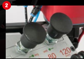
Umschaltknopf manuell / automatisch und eng / weit