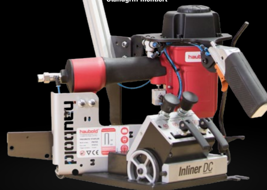
Griffverlängerung als Standgriff montiert