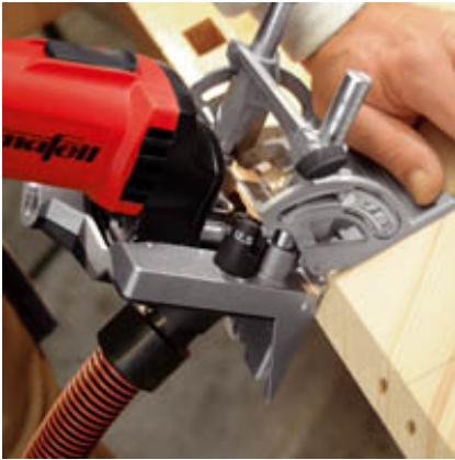
Schnell und exakt: Eckverbindung stumpf oder auf Gehrung.