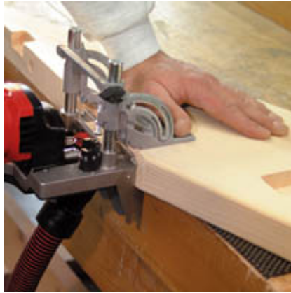
Arbeiten beim Treppenbau, in der Werkstatt oder auf Montageeinsätzen.