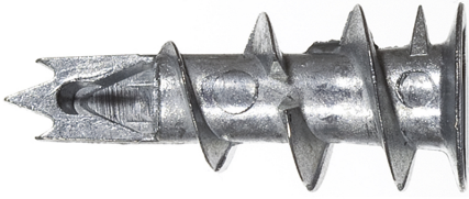
Gipskartondübel Metall GKM