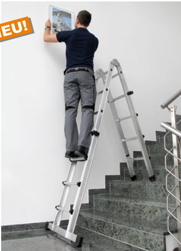
Abb. Bestell-Nr. 32122