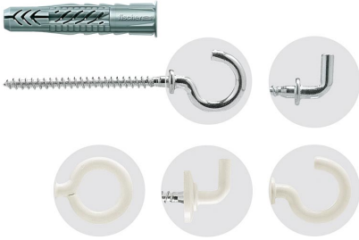
Universaldübel UX mit Haken